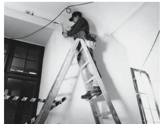
Die obersten 3 Sprossen geben den nötigen Halt.

Weitere Informationen: «Tragbare Leitern können ganz schön gefährlich sein» (Bestellnummer: 44026)