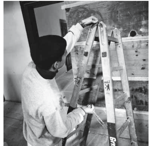
Intakte Leitern sind Voraussetzung für sicheres Arbeiten.