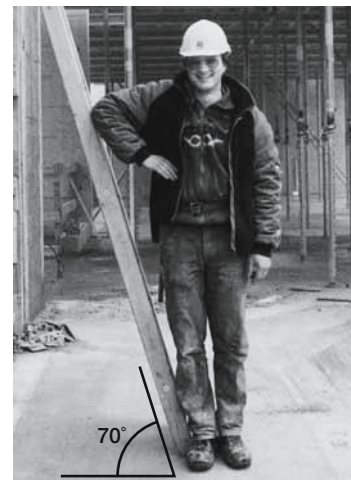
Die richtige Neigung der Leiter lässt sich mit der Ellbogenprobe bestimmen.