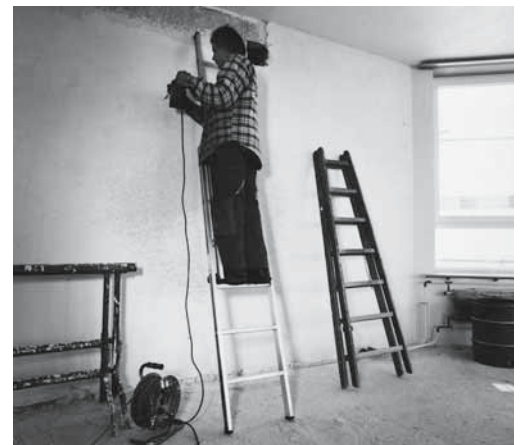
Wenn man eine Bockleiter als Anstell-Leiter benützt, wird durch die einseitige Belastung das Scharnier beschädigt.