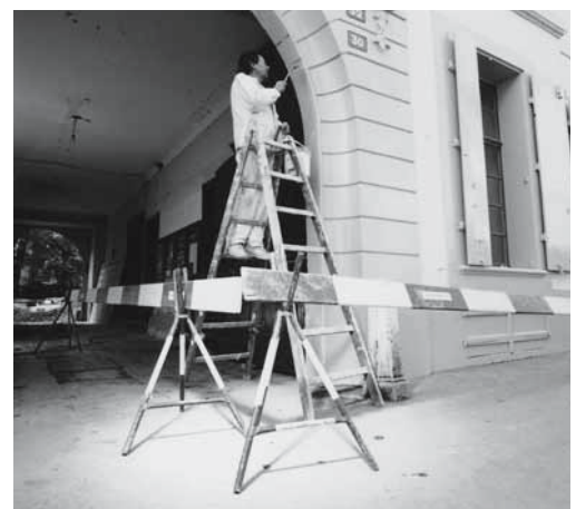
Gesicherter Standort im Verkehrsbereich.