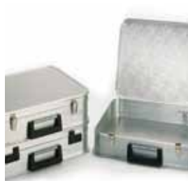
Abb. Best.-Nr. GA10143901