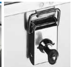
Zylinderschlösser, gleichschliessend Abb. Best.-Nr. GA45031001