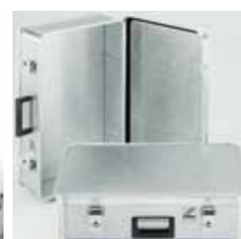
Abb. Best.-Nr. GA10153901