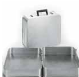
Abb. Best.-Nr. GA10148901