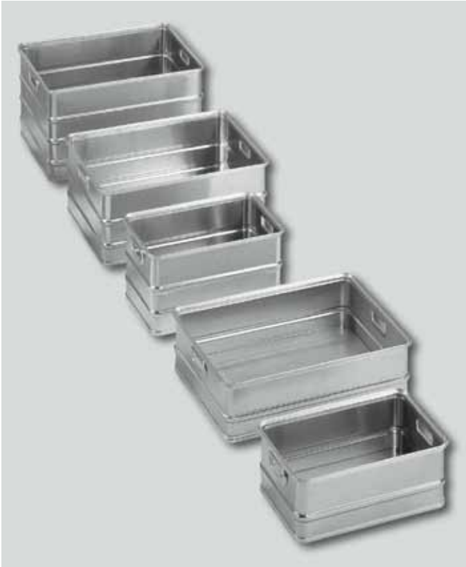
Übersicht aller Transportkästen

Transportkasten aus Leichtmetall mit glatter Oberfläche. Behälter mit umlaufenden Pressprofilen an den Rändern, mit 2 Schalengriffen, stapelbar. Die Modelle haben auf die Euro-Palette abgestimmte Grundflächenmasse. Wände sind durch umlaufende trapezförmig ausgeprägte Sicken versteift. Sondergrößen ab 20 Stück.