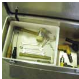
Kunststoff-Einsatzkasten auf Alu-Auflageleisten. Abb. Best.-Nr. GA06959901 und GA45959901