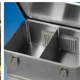
Trennwandsystem: 1 Trennwand, 1 Paar Trennwandführungen. Abb. Best.-Nr. GA45153904 und GA45150001